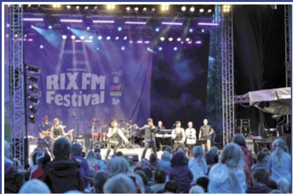
Fullt hus då Erik Saade framträdde på Helsingborgsfestivalen.